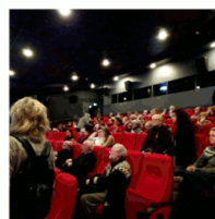
Bio Asta begynder at fylde