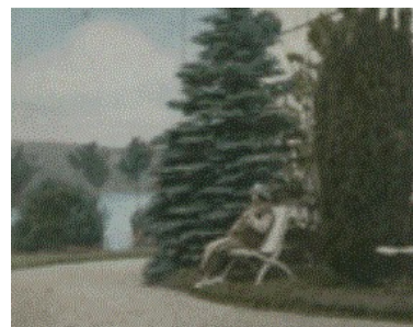
Karin bei Torelore