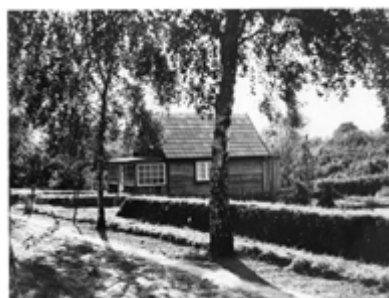
Et af gæstehusene ved Torelore