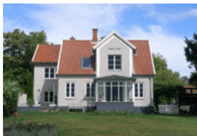
Torelore i dag