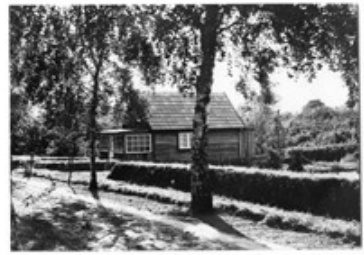
Gästehaus bei Torelore