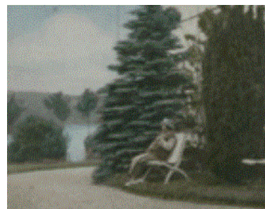
Karin ved Torelore