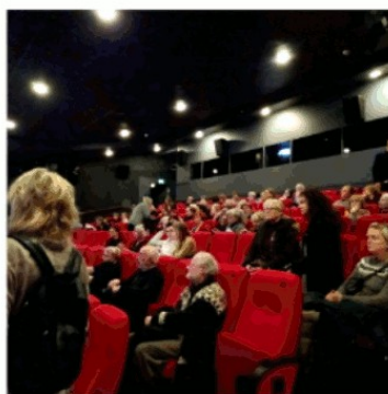
Bio Asta begynder at fyldes